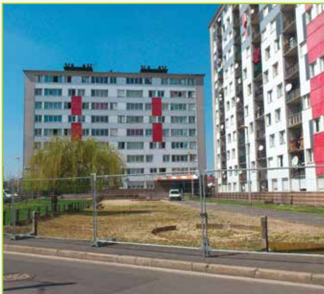
La cité de la Renardière vue depuis la rue des Processions, avant travaux de réhabilitation et résidentialisation.