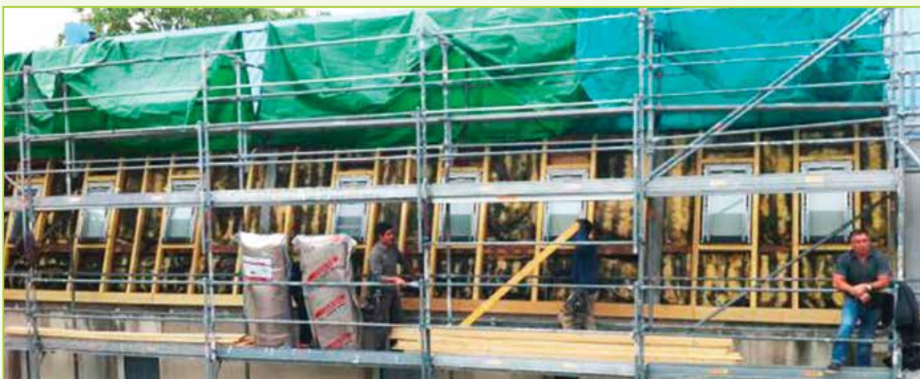
Les travaux de toiture des bâtiments de l'allée du Moulin Fondu à Merlan se poursuivent. Après dépose de la toiture existante, l'isolation gorgée d'eau ne jouait plus son rôle. Il était temps d'intervenir pour rénover cette toiture qui n'a pourtant pas 20 ans.

Les entreprises s'affèrent au 23 rue Moissan / 21 boulevard Michelet, pour la création des bureaux du nouveau siège qui vous accueillera à la rentrée de septembre.